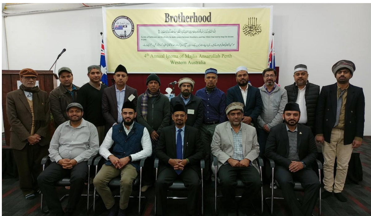
Group photo of members of Majlis Ansarullah Perth with Respected Sadr sahib Majlis Ansarulla Australia