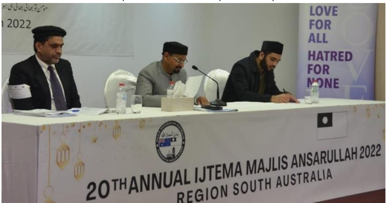
Question and Answer Session