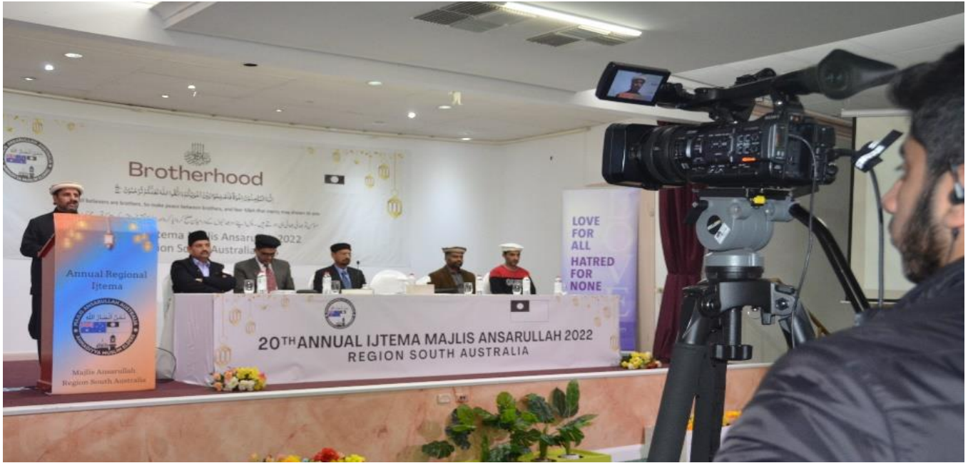
Nazim-e Aala Ijtema presenting Ijtema Report