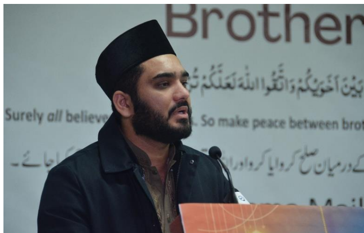
Respected Murabee Sahib speech on Prayer