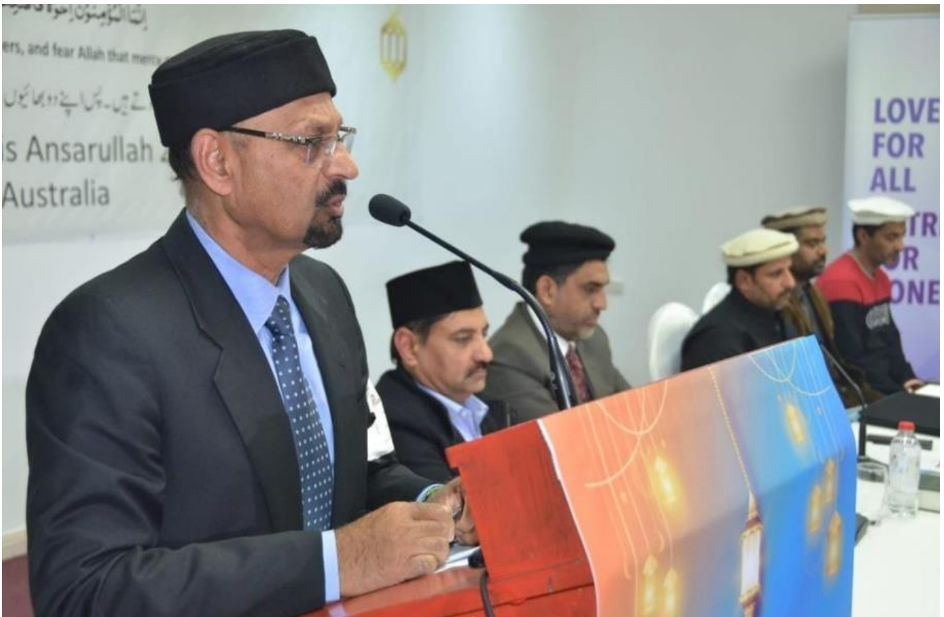
Concluding Address by Respected Sadr Sahib Majlis Ansarullah Australia